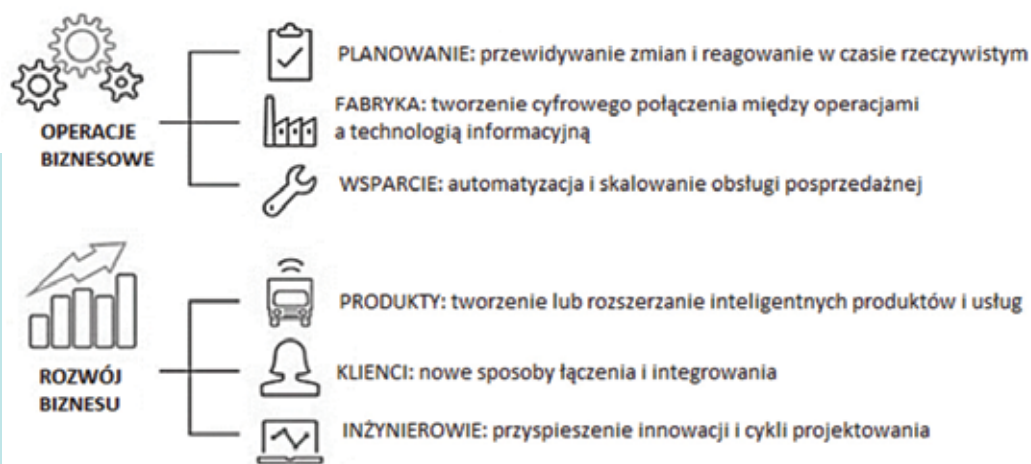
Rys. 1. Role transformacyjne Przemysłu 4.0 Źródło: Opracowanie własne na podstawie [6]

łączą się granice wewnętrzne i zewnętrzne, a klasyczne granice poszczególnych przedsiębiorstw zostaną przesunięte. Przemysł 4.0 digitalizuje i integruje procesy w pionie w całej organizacji, poprzez wszystkie funkcje, od rozwoju produktu i zakupów, przez produkcję, logistykę i obsługę posprzedażną. Oprócz tego, integracja pozioma wykracza poza operacje wewnętrzne. Tutaj również zintegrowani są dostawcy, klienci i wszyscy kluczowi partnerzy łańcucha wartości [1]. Pełna cyfryzacja tych łańcuchów może potencjalnie zwiększyć poziomy produktywności, ale wymaga właśnie wspomnianego zintegrowania wertykalnego i pionowego dzielenia się informacjami oraz decentralizacji procesu decyzyjnego [22].